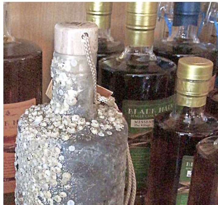
Nach wenigen Monaten sind die Flaschen von Seepocken besiedelt.