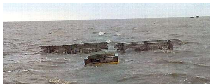
Auf der Nordseite der Sylter Tidebank liegt der Whiskey aus Neuses.